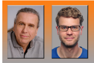
Heiko Schwarzburger © Mildred Klaus Heils H. Petersen © privat